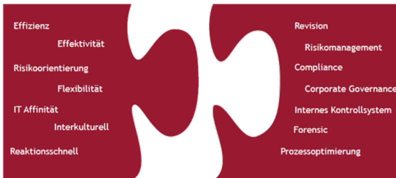
ABB: Erwartung an die Interne Revision

Diese neuen Anforderungen an die Revision basieren auf den spezifischen Erfahrungen, welche im Rahmen der Tätigkeiten erlangt und vertieft wurden. So sind vielfältige Erwartungen an die Revisionsfunktion entstanden, die über das eigentliche Spektrum hinausgehen und mit der Komplexität des Unternehmens steigen. Vermehrt wird die Revisionsfunktion so in Fragestellungen aus den Bereichen Risikomanagement oder Prozessoptimierung eingebunden, wobei dabei die Aufgaben in der Prüfung interner Kontrollstrukturen, von Prozessen oder aber Compliance Themen bestehen.